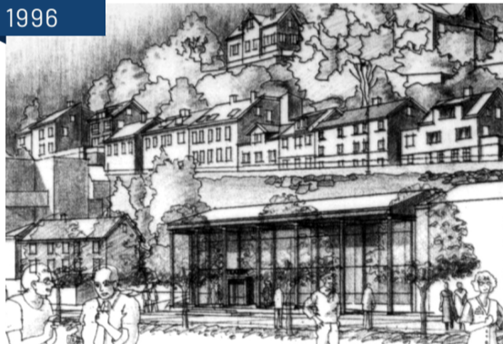
Forslag til Kulturhus i fjellet under Strømsbuveien, 1996. Arkitekt Terje Walle v/Kjell Jensen arkitektkontor.