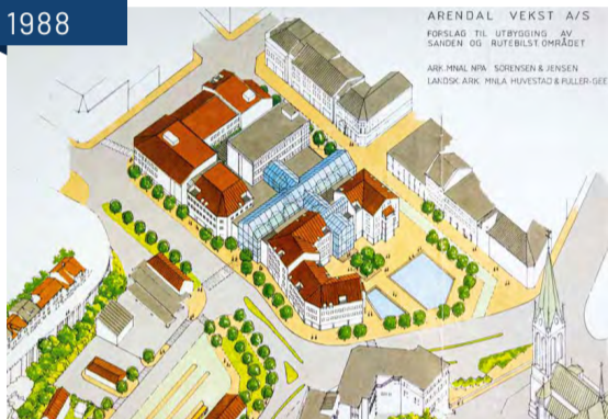
Arendal Vekst AS forslag til utbygging av dagens Arendal kultur, rådhus og Sam Eydes plass, 1988. Arkitekt Sørensen og Jensen, landskapsark. Huvestad & Fuller-Gee.