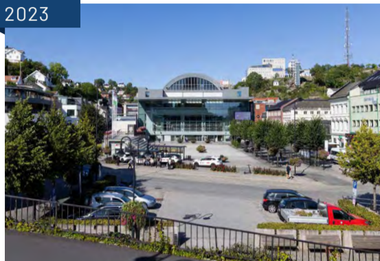
Arendals kultur og rådhus med Sam Eydes plass foran, sett fra Kirkebakken. Her var tidligere vannspeil, og så rutebilstasjonen med bussholdeplass.