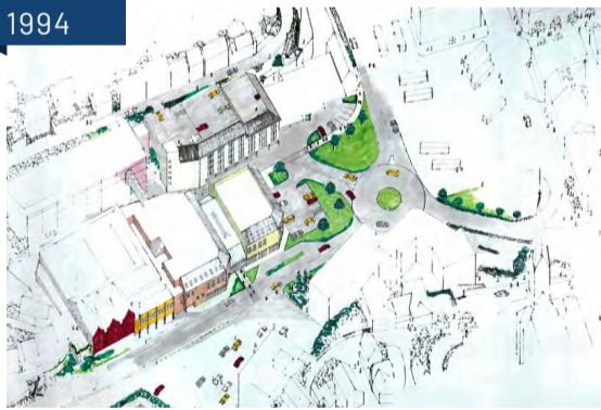
A.S.Varehus, forslag til utvikling av Arenasenteret (dagens Altisenter). Arkitekt: Svein Sørensen, 1994