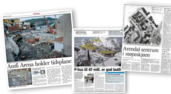
Avisutklipp, fra venstre til høyre: Agderposten-10.10.2006, Agderposten-21.11.2005, Agderposten-23.08.1986.