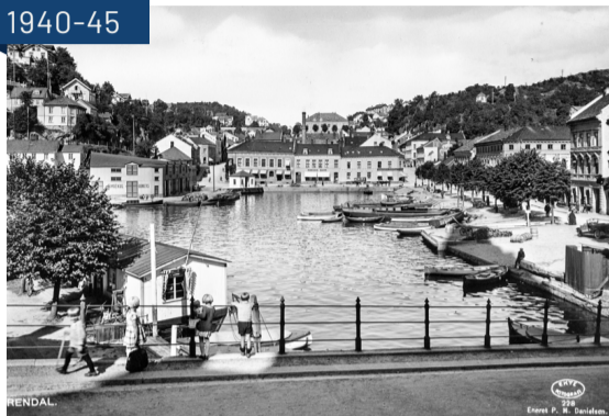
Sanden før den ble gjenfylt ca. 1947. Perspektiv fra Kirkebakken mot Arendal kultur- og rådhus.