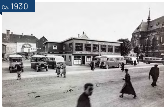
Kanalplassen med rutebilstasjon og møbelbutikk rundt 1930-tallet.