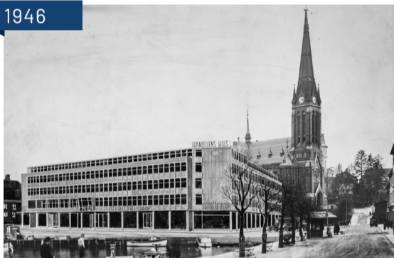
Ugland og Thorne sitt forslag til Handelshuset på Kanalplassen Arendal, 1946.