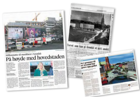
Avisklipp fra venstre til høyre: Agderposten 03.12.2019, Agderposten 06.10.1960, Agderposten 13.04.2019.