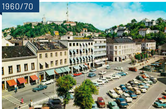
Kanalplassen og Kirkegaten med kjørevei og stor bilparkering, siste halvdel av 1960-tallet.