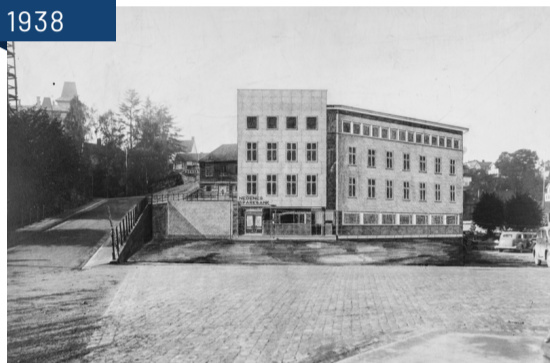
Ugland og Thorne sitt forslag til Nedenes Sparebank, Kanalplassen 1938. Sett mot Kirkebakken og dagens sparebank. Arkivref: PA-2388.T01.0013, Aust-Agder museum & arkiv, KUBEN.