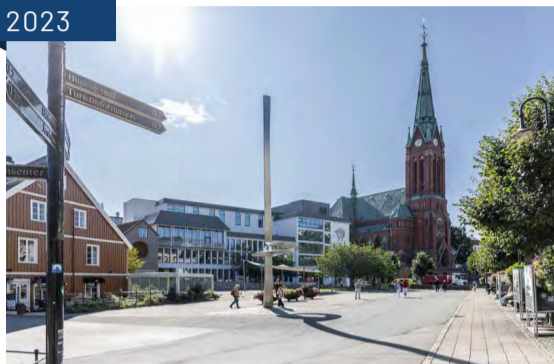
Kanalplassen i dag.