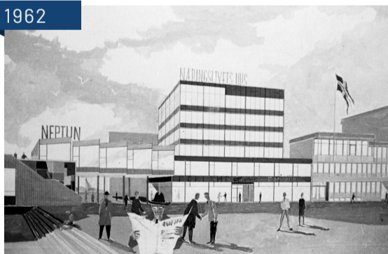
Handelstandens prosjekt fra 1962 for "Næringslivets hus" i forlengelse av posthusetbygget mot Pollen. Arkitekter Ugland og Thorne.