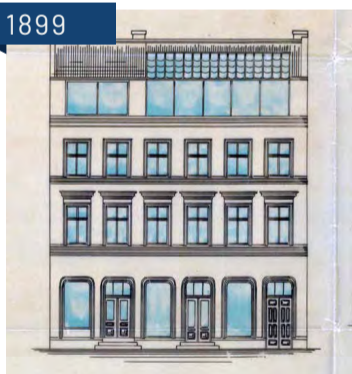
Av tegninger ser vi at allerede i 1899 søkte arkitekt Egon Schmusser om å løfte taket på murgården på det gamle bygget.