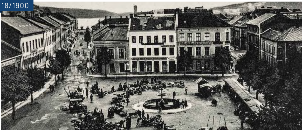
Torvet med murkvartale rundt århundreskifte.