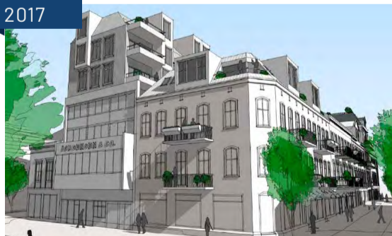
Arendal kommune tok initiativ til å se på muligheter for å bygge i høyden, i samarbeid med forskjellige gårdeiere som et vitaliseringsprosjekt. Her med Jørgensen. Perspektiv mot gågata og Jørgensen, 2017. Arkitekt: Arki-Tek v/ Marco Rimensberge