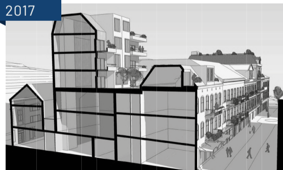
Her nærbilde av samme prosjekt med etasjer og muligheter på toppen av Jørgensen, 2017. Arkitekt: Arki-Tek v/ Marco Rimensberge

Etter bybrannen i 1868 ble murkvartalene bygget opp på få år. Tidlig på 1900 tallet kjøpte Jørgensen familien murgården på tomten Torvet 11 og startet bakeri der.