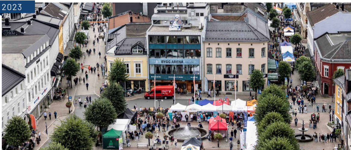
Torvet 2023.