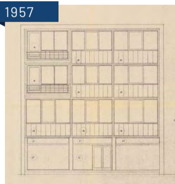
Forslag til nytt bygg tegnet av arkitekt Einar Fiane i 1957.