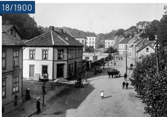
Blødekjær ca. slutten av 1800- begynnelsen 1900 tallet. Foto: PM Danielsen. AAA-PA-2405.L7.040, CC BY-SA. Aust-Agder museum & arkiv, KUBEN.