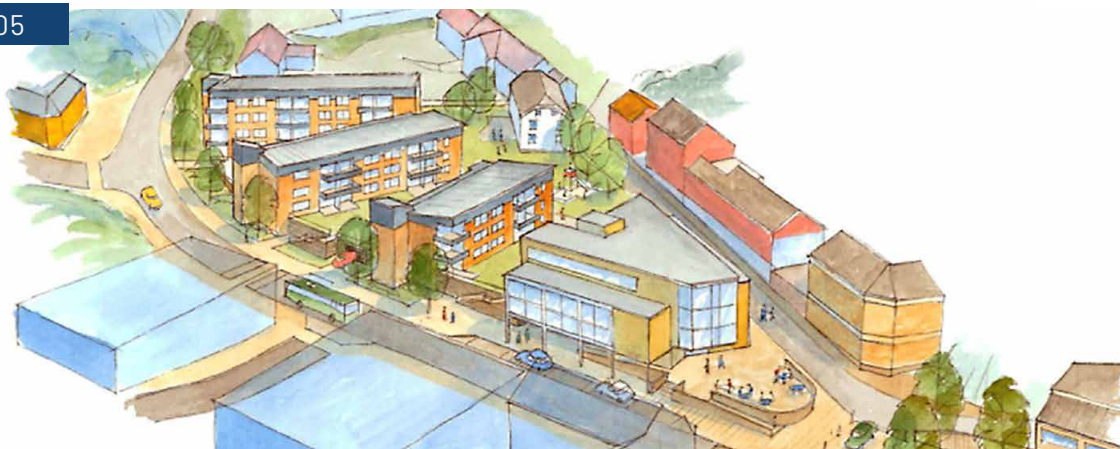
Forslag til revitalisering av Blødekjær. Tegnet av Asplan viak v/ arkitekt Harald Tallaksen.