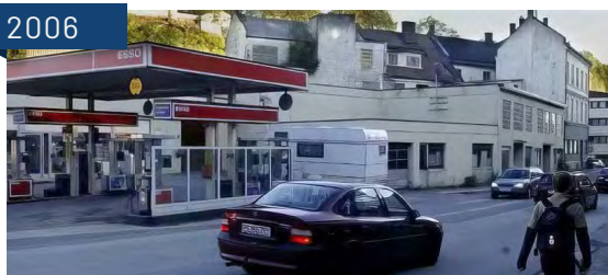
Den gamle Essostasjonen i Blødekjær.