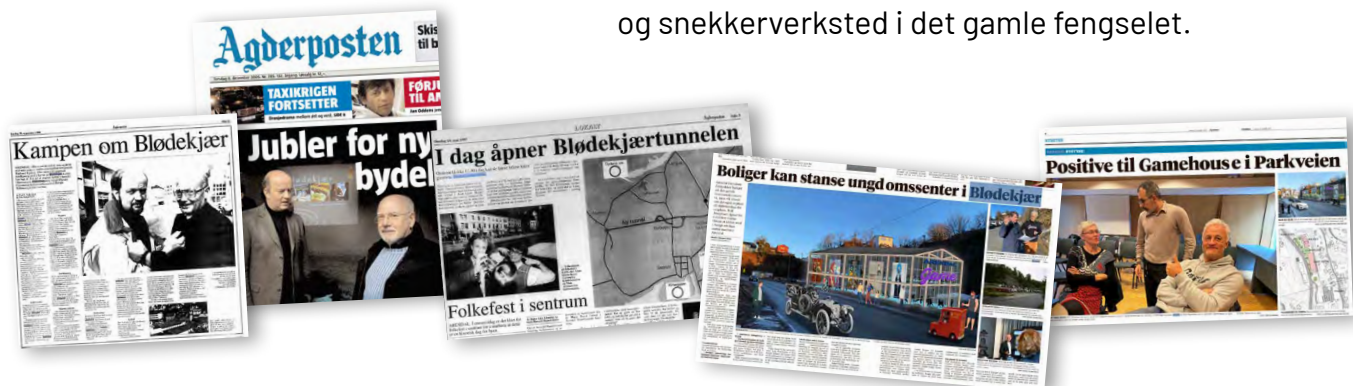
Avisutklipp, fra venstre til høyre: Agderposten-29.09.1990, Agderposten-08.12.2005, Agderposten-10.05.1995, Agderposten-29.08.2022, Agderposten-29.10.2022.