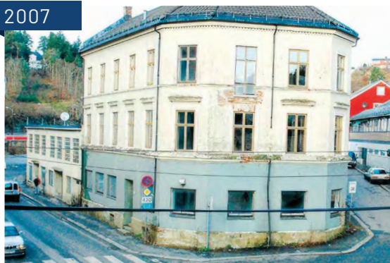
Den verneverdige murgården fra 1880-årene var den bygningen folk med størst Blødekjær-hjerte gjerne ville ha bevart i 2007.