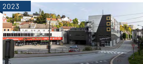
Blødekjær 2023.